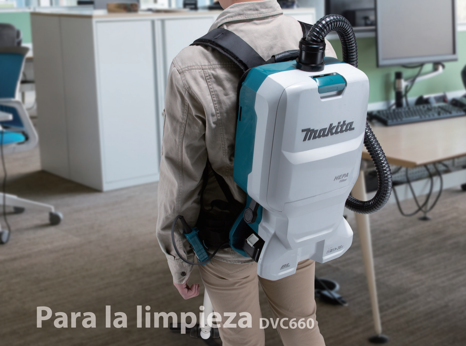
Para la limpieza DVC660