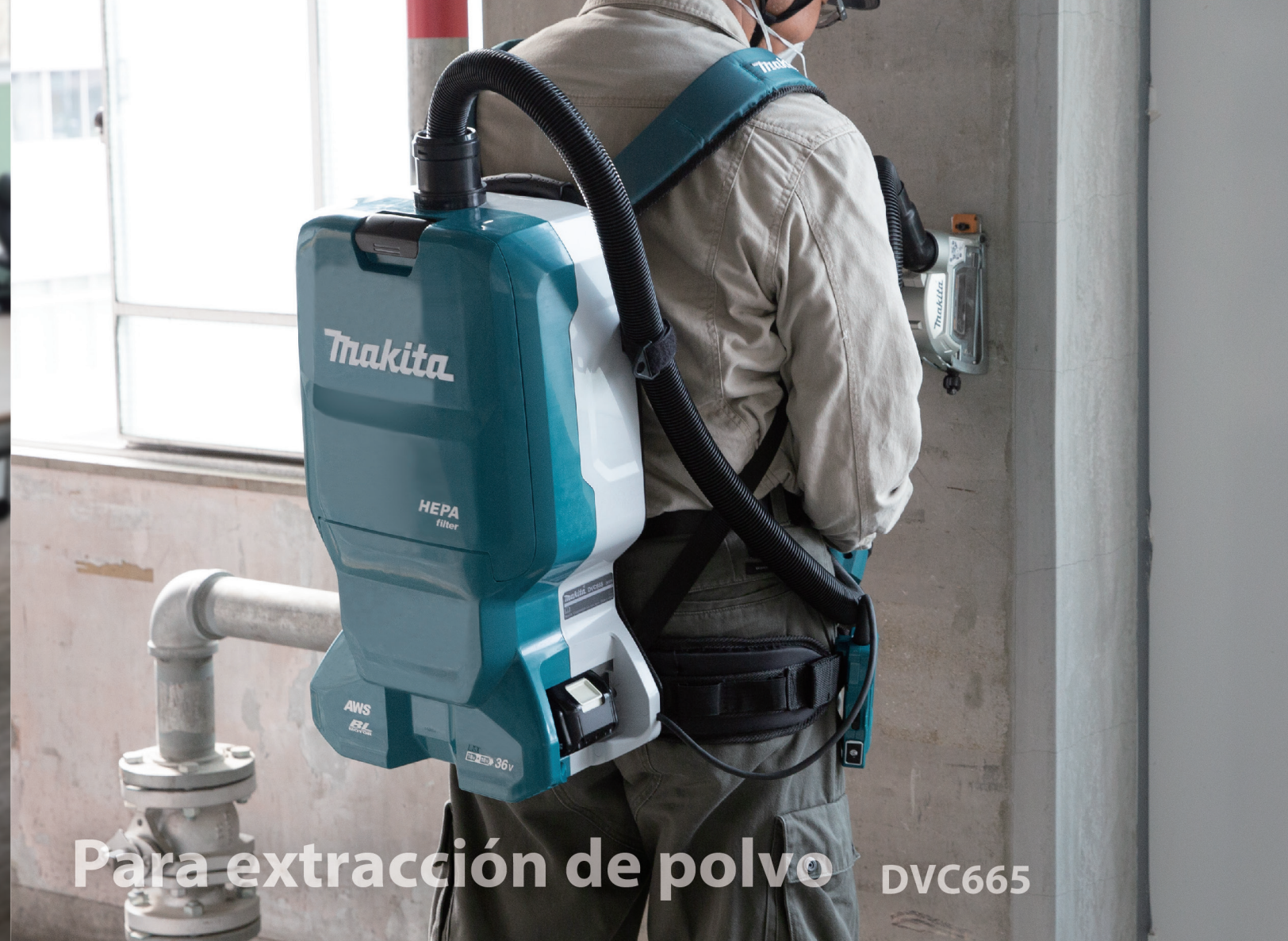
Para extracción de polvo DVC665